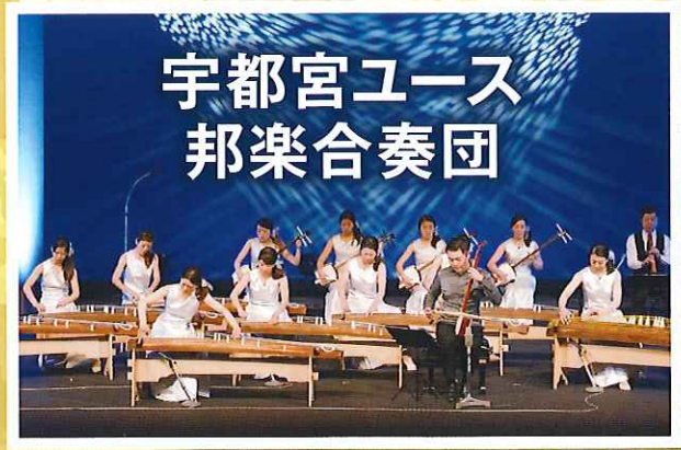
宇都宮ユース 邦楽合奏団